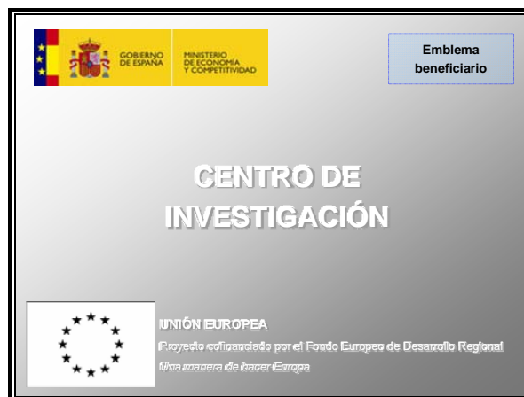
Figura 2: Ejemplo de placa explicativa en centros construidos

La siguiente figura muestra un ejemplo de placa explicativa: