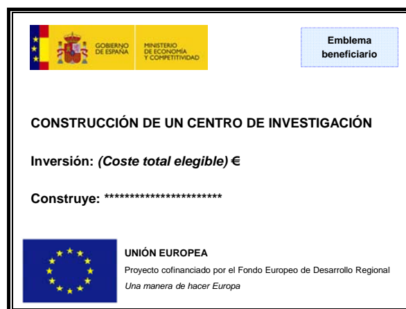
Figura 1: Ejemplo de cartel en obra de construcción

La siguiente figura muestra un ejemplo de cartel: