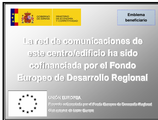
Figura 4: Ejemplo de placa explicativa en red de comunicación

La siguiente figura muestra un ejemplo de placa explicativa: