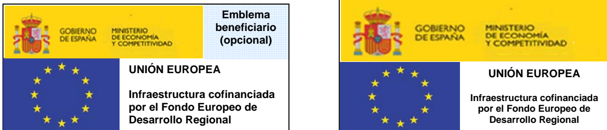
Figura 3: Ejemplos de adhesivo para colocar en los equipos cofinanciados

La siguiente figura muestra dos ejemplos de adhesivo: